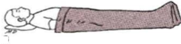
Gambar 3. Pasien berbaring di tempat tidur / Horizontal