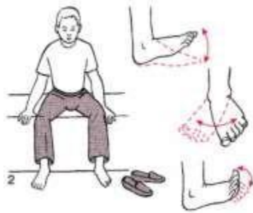
Gambar 2. Menggantungkan ekstremitas bawah/kaki