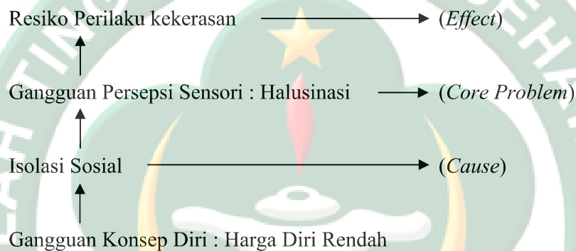
Gambar 2.1 Pohon Masalah Halusinasi

Pohon masalah pada halusinasi dapat diuraikan sebagai berikut (Prabowo, 2014) :