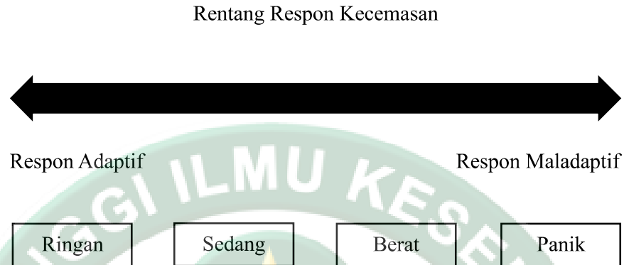
Gambar 2.1 Rentang Respon Kecemasan (Bangu et al., 2023).