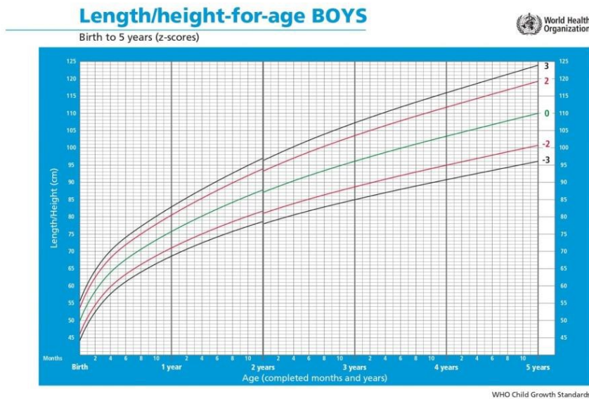
Gambar 2.1 Pengukuran TB/U anak laki-laki